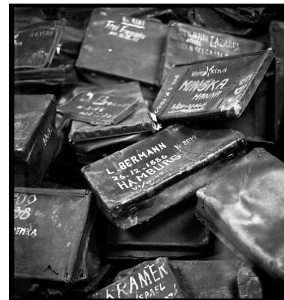
Musée d'Auschwitz - © Guillaume Ribot

École normale supérieure - Mémorial de la Shoah - Archives nationales